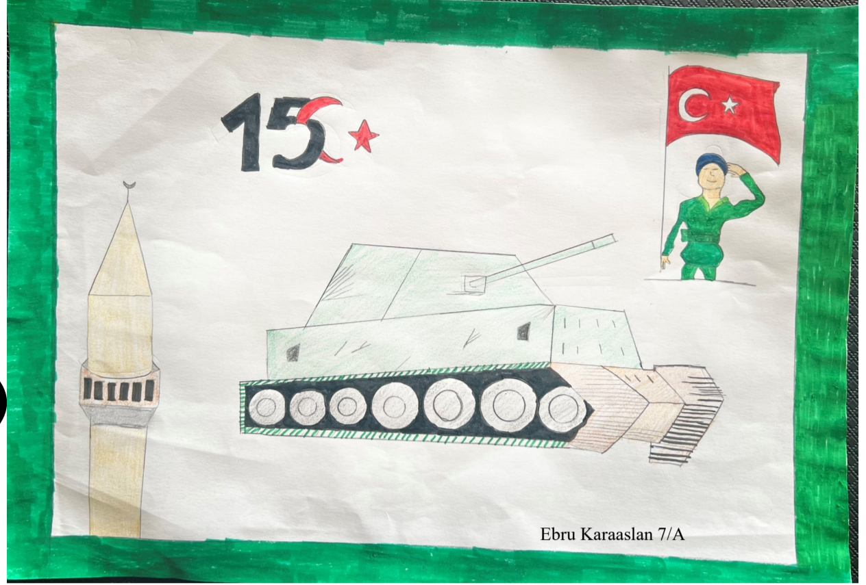
Ebru Karaaslan 7/A